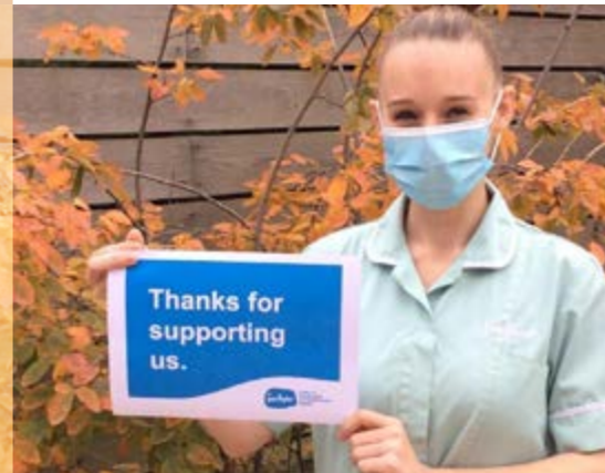
151 Rapport d'activité 2020 | Fondation Artelia

« Nous serons toujours nombreux à considérer 2020 comme l'une des années les plus difficiles que nous ayons connues. Chez Sue Ryder cette année restera toujours celle de l'admiration totale pour notre personnel, nos patients et nos donateurs. »