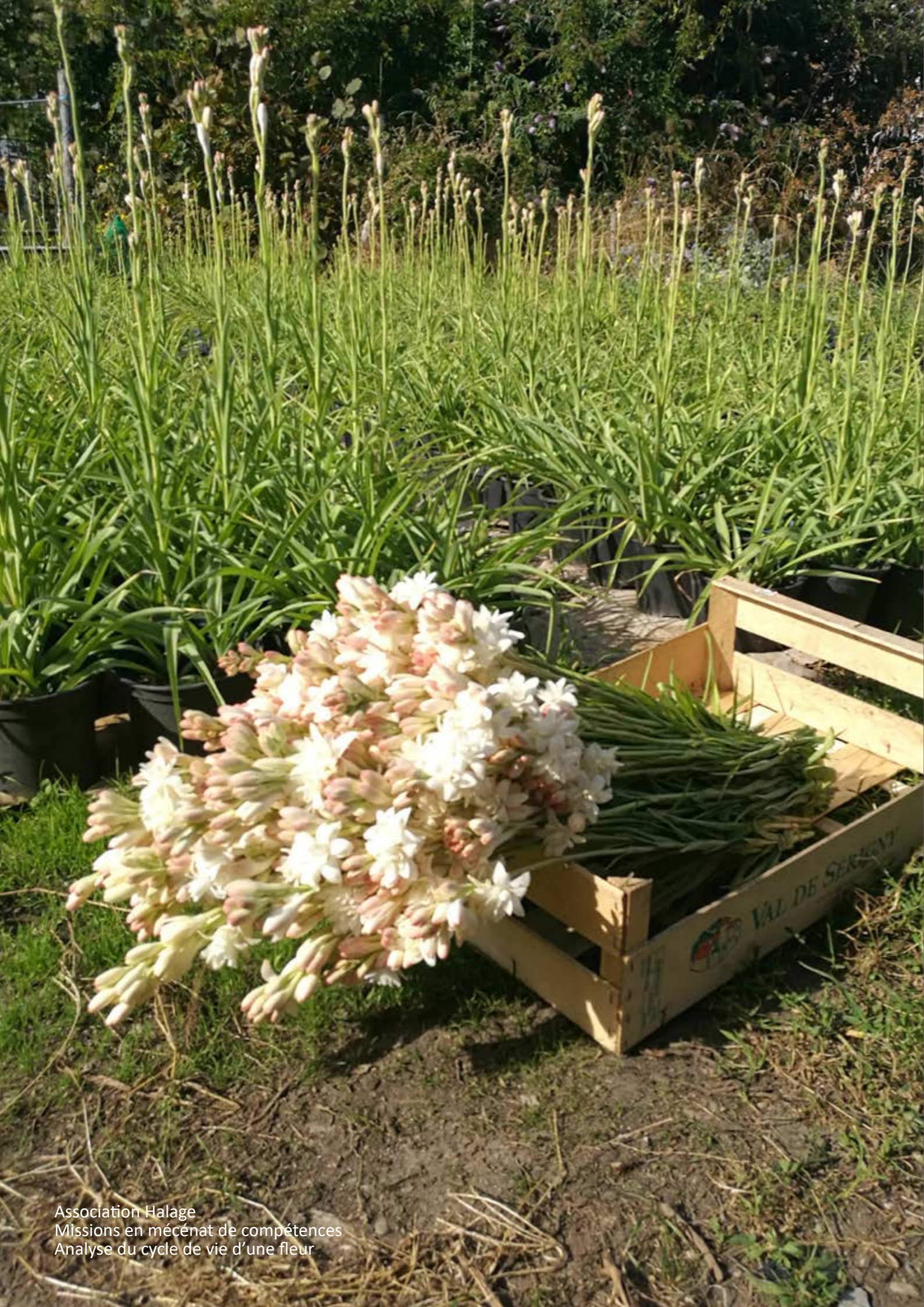
Association Halage Missions en mécénat de compétences Analyse du cycle de vie d'une fleur